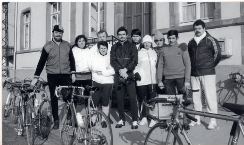
Le Cyclo-Club en 1985 (de gauche à droite) :