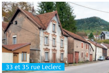
33 et 35 rue Leclerc

Le 21 octobre 2021, le conseil municipal s'est réuni en séance plénière à la salle des fêtes. Après l'approbation du compte rendu de la séance précédente, les conseillers ont pris les délibérations suivantes : création d'un emploi permanent de responsable des Services Techniques municipaux, puis signature d'une convention avec le Centre de Gestion des Vosges pour l'accompagnement de ce recrutement (notamment au niveau juridique), mise à jour du tableau des emplois (avancements de grade du personnel communal), annualisation du temps de travail du personnel communal sur 1 607 heures (suite à l'entrée en vigueur le 1 er janvier 2022 de la loi du 6 août 2019 sur la transformation de la fonction publique), dépôt d'une demande de subvention au FEADER (Fonds Européen Agricole pour le Développement Rural) pour la création d'une nouvelle aire de jeux à proximité de l'abbaye, le long de la Voie Verte, incorporation de 3 biens « sans maître » dans le domaine communal, approbation de la nouvelle répartition du capital social de la société publique local « SPL-Xdemat » dont la